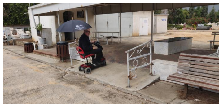
עצמאות ניידות במרחב בית העלמין